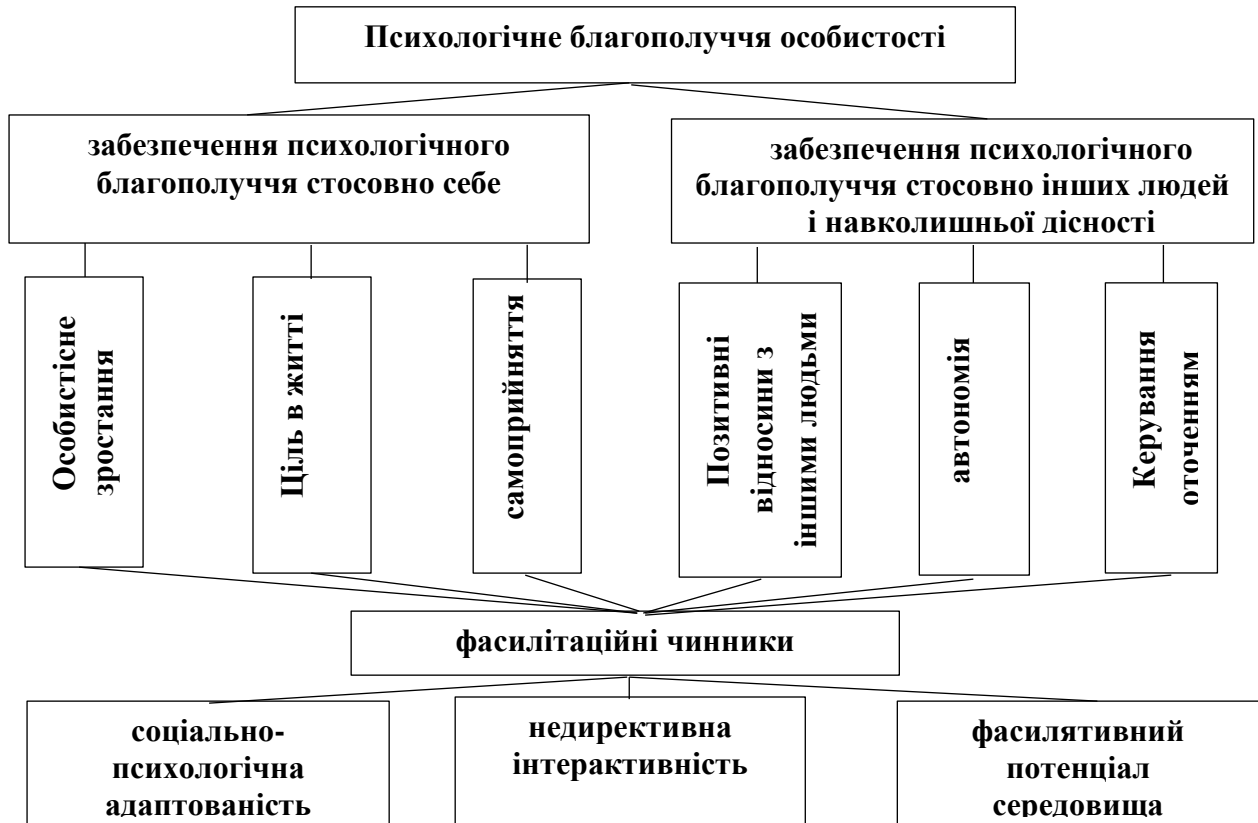
Рис. 1. Модель фасилітаційної детермінації психологічного благополуччя особистості

Розроблено теоретичну модель фасилітаційної детермінації психологічного благополуччя особистості , в якій відображено її основні структурні характеристики (Рис. 1).